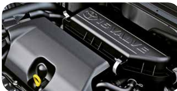
Motores 1.3 e 1.5 I6V.