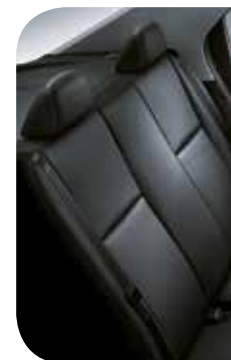
Bancos Comfort Drive