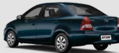
Etios XS 1.5

Inclui itens da versão Etios X + acabamento preto na coluna central (exceto veículo na cor Preto Rock), acabamento dos bancos em tecido (parte anterior dos braços) e material sintético, difusores de ar com acabamento cromado, sistema de alarme, chave com controle de abertura das portas, volante com controle de áudio, rádio com função MP3, Bluetooth® e entrada USB, dois alto-falantes e dois tweeters.