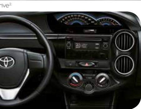
com controle de áudio 1