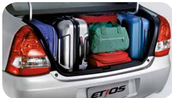
Porta-malas do Etios sedã com capacidade de 562 litros: um dos maiores da categoria.