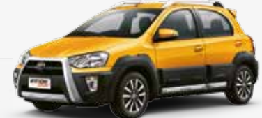
Amarelo Reggae (5A3)