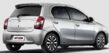
Etios Platinum 1.5

Inclui itens da versão Etios XLS, sistema multimídia com áudio, TV digital, DVD, GPS, câmera de ré e Bluetooth® , design exclusivo da roda de liga leve arô 15", bancos revestidos em couro e material sintético*, grade dianteira cromada, faróis de neblina com acabamento cromado na parte inferior e superior do porta-malas, máscara na lanterna traseira, manopla de câmbio em couro com acabamento cromado na base, e sensor de estacionamento na cor do carro.