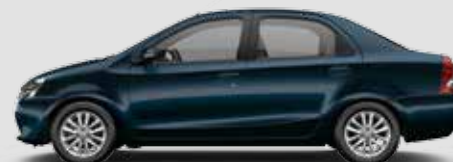
Etios XLS 1.5

Inclui itens da versão Etios XS + rodas de liga leve arô 15", faróis de neblina dianteiros, volante de couro, grade dianteira com acabamento cromado, espelhos retrovisores elétricos com pisca integrado, bancos Comfort Drive** e friso cromado na parte superior do porta-malas.