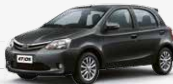
Cinza Jazz (1J3)