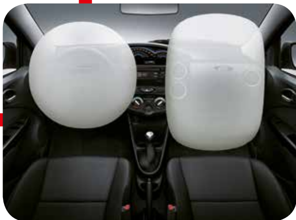
Air bag frontal.

(I) O teste feito no Toyota Etios pelo Latin NCAP ocorreu no dia 17/10/2012 em Landsberg, na Alemanha. Resultado disponível em www.latinncap.com .