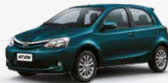
Azul Techno (785)