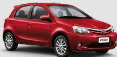
Etios XLS 1.5

Inclui itens da versão Etios XS + rodas de liga leve arô 15", faróis de neblina dianteiros, volante de couro, grade dianteira com acabamento cromado, espelhos retrovisores elétricos com pisca integrado, bancos Comfort Drive** e friso cromado na parte superior do porta-malas.