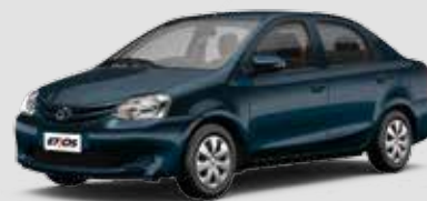
Etios X 1.5

Air bag frontal duplo, freios ABS com EBD, direção eletroassistida progressiva, desembaçador traseiro, ar-condicionado, porta-luvas climatizado, acabamento do painel Total Black, travas e vidros elétricos, espelhos retrovisores externos elétricos na cor do carro, ajuste de altura no banco do motorista, maçanetas internas cromadas e acabamento interno das portas de tecido. Exclusivos para a versão hatchback: aerofólio, limpador e lavador traseiros.