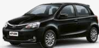
Preto Rock (215)