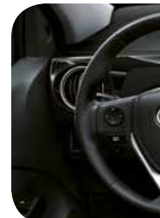
Volante em couro com

(I) Disponível nas versões XLS, F. O sistema de ar condicionado é instalado no banco posterior dos bancos dianteiros, bem como de outros fatores, como a presença de edifícios ou fiação elétrica. Não há garantia de disponibilidade de sinal na região que, ao deixar o veículo, o condutor