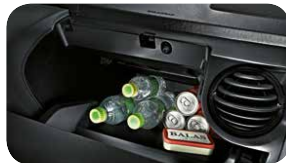
Porta-luvas climatizado de 13 litros.

Platinum e Cross. (2) Disponível nas versões XLS e Cross, banco revestido de material sintético. (3) Banco com partes revestidas de couro (parte anterior dos bancos dianteiros e traseiros) e partes revestidas de material sintético (parte traseira, laterais dos bancos dianteiros e traseiros, laterais e parte anterior e posterior dos apoios de cabeça dianteiros e traseiros). (4) Disponível na versão Platinum. (5) O funcionamento do GPS depende da disponibilidade de sinal na região, como a visão desobstruída do céu. A recepção do sinal, por sua vez, pode ser interrompida facilmente por películas protetoras nos vidros, telefones móveis ou dispositivos eletrônicos, rastreadores próximos ao GPS, existência de árvores, entre outros. Em todos os municípios do território nacional estão presentes na área de cobertura do mapa. Por motivos de segurança, as imagens da TV e DVD não serão exibidas quando o veículo estiver em movimento. O funcionamento depende de uma bateria de 12V. Micro Card - Para sua segurança, não manuseie o cartão de memória SD Card quando estiver dirigindo. Quando o cartão de memória SD Card não estiver inserido, nenhum mapa será exibido no sistema multimídia. Recomenda-se sempre manter o SD Card em local não visível a fim de evitar que seja roubado. No caso de perda, roubo ou dano (que impossibilite o uso), outro cartão de memória SD Card poderá ser adquirido na concessionária Toyota.