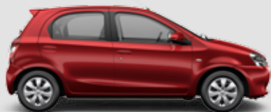
Etios XS 1.5

Inclui itens da versão Etios X + acabamento preto na coluna central (exceto veículo na cor Preto Rock), acabamento dos bancos em tecido (parte anterior dos braços) e material sintético, difusores de ar com acabamento cromado, sistema de alarme, chave com controle de abertura das portas, volante com controle de áudio, rádio com função MP3, Bluetooth® e entrada USB, dois alto-falantes e dois tweeters.