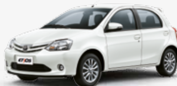
Branco Pérola (070)