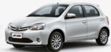
Prata Soul (1H6)