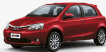
Vermelho Pop (351)

Somente a versão Cross está disponível em Amarelo Reggae. Versão Platinum disponível apenas nas cores Prata Soul e Preto Rock.