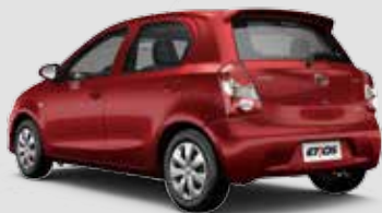
Etios X 1.3

Air bag frontal duplo, freios ABS com EBD, direção eletroassistida progressiva, desembaçador traseiro, ar-condicionado, porta-luvas climatizado, acabamento do painel Total Black, travas e vidros elétricos, espelhos retrovisores externos elétricos na cor do carro, ajuste de altura no banco do motorista, maçanetas internas cromadas e acabamento interno das portas de tecido. Exclusivos para a versão hatchback: aerofólio, limpador e lavador traseiros.