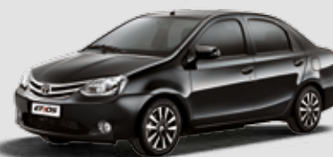
Etios Platinum 1.5

Inclui itens da versão Etios XLS, sistema multimídia com áudio, TV digital, DVD, GPS, câmera de ré e Bluetooth® , design exclusivo da roda de liga leve arô 15", bancos revestidos em couro e material sintético*, grade dianteira cromada, faróis de neblina com acabamento cromado na parte inferior e superior do porta-malas, máscara na lanterna traseira, manopla de câmbio em couro com acabamento cromado na base, e sensor de estacionamento na cor do carro.