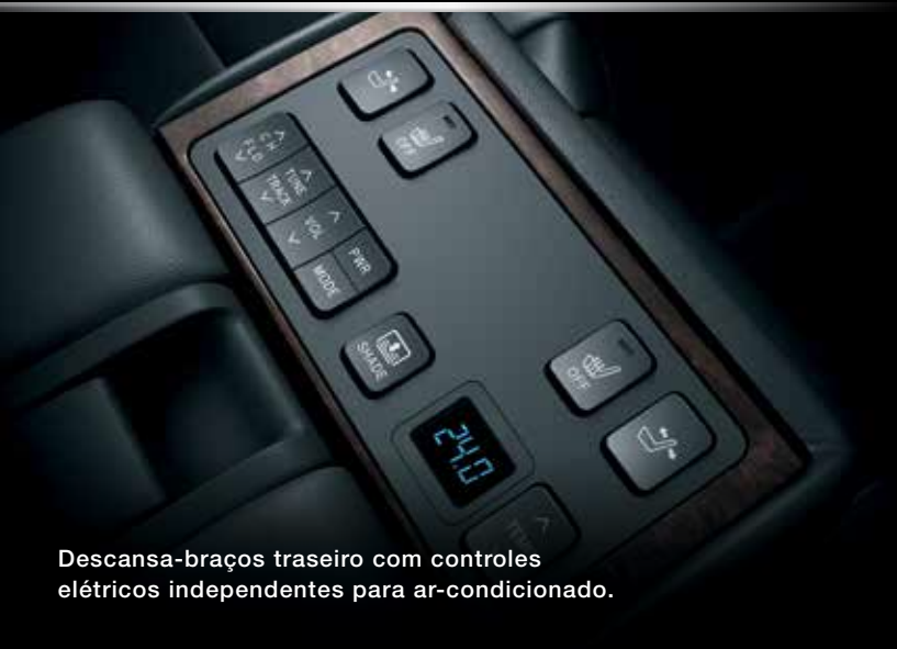
Descansa-braços traseiro com controles elétricos independentes para ar-condicionado.