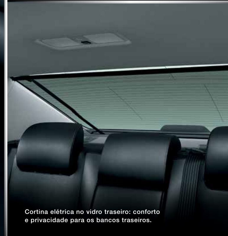
Cortina elétrica no vidro traseiro: conforto e privacidade para os bancos traseiros.