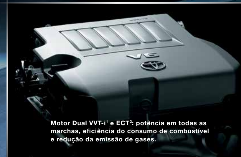
Motor Dual VVT-i 1 e ECT 2 : potência em todas as marchas, eficiência do consumo de combustível e redução da emissão de gases.