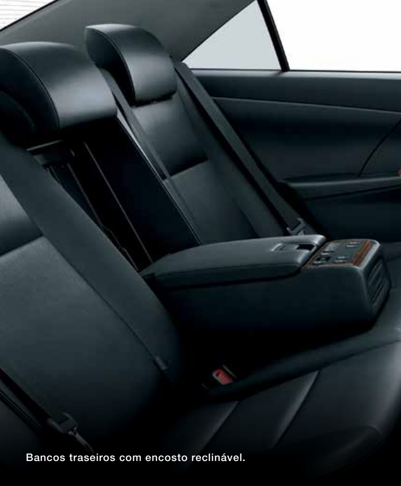
Bancos traseiros com encosto reclinável.