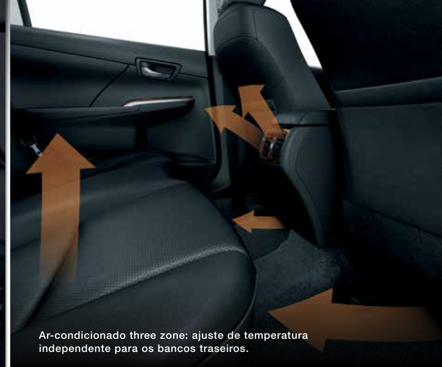
Ar-condicionado three zone: ajuste de temperatura independente para os bancos traseiros.