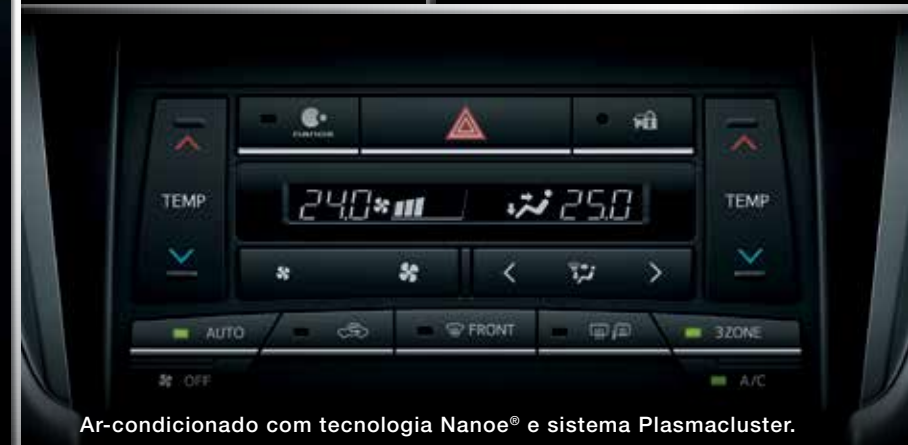
Ar-condicionado com tecnologia Nanoe® e sistema Plasmacluster.