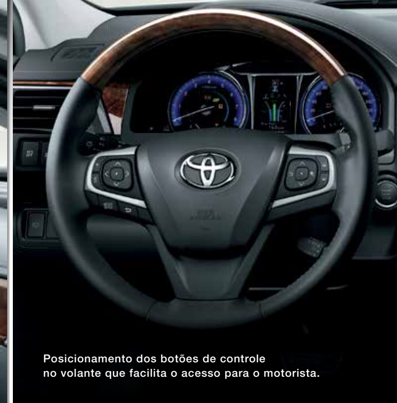
Posicionamento dos botões de controle no volante que facilita o acesso para o motorista.