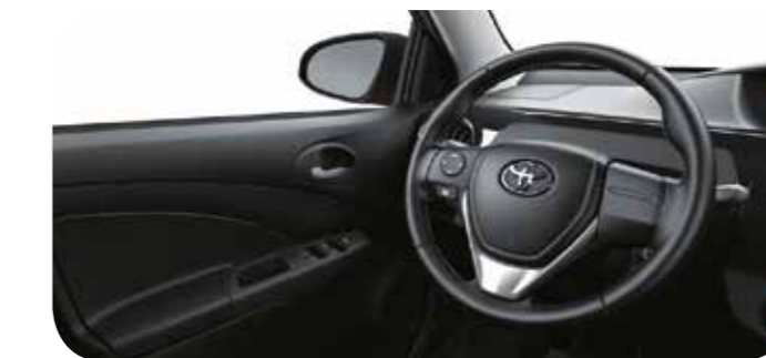
Volante revestido de couro com controle de áudio 3