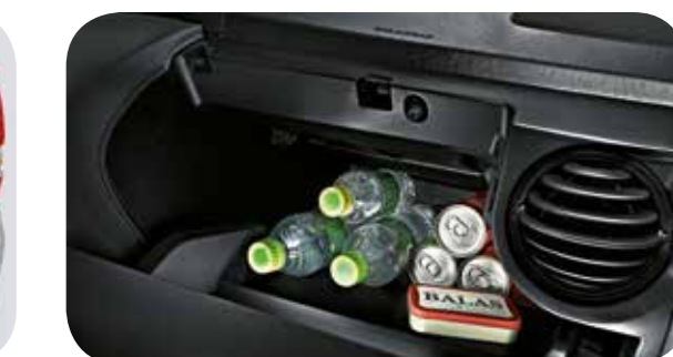
Porta-luvas climatizado de 13 litros