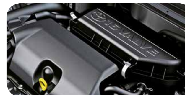
Motores 1.3 e 1.5 16V.