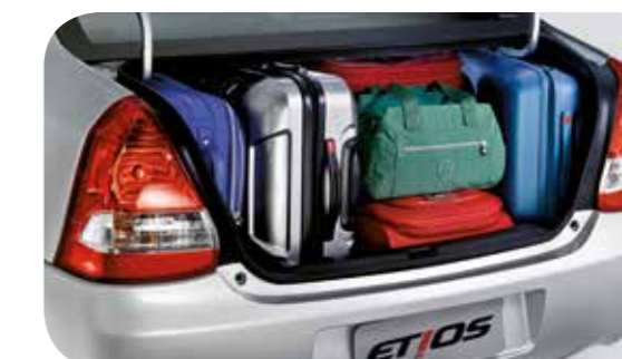
Porta-malas do Etios sedã com capacidade de 562 litros, um dos maiores da categoria