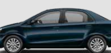
Etios XLS 1.5

Inclui itens da versão Etios XS + rodas de liga leve aro 15", faróis de neblina dianteiros, volante de couro, grade dianteira com acabamento cromado, espelhos retrovisores elétricos com piscas integradas, bancos Comfort Drive**, friso cromado na parte superior do porta-malas e rádio com função MP3, entrada USB, Bluetooth® e conexão smartphone.