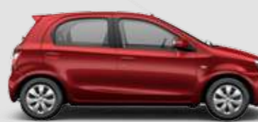
Etios XS 1.5

Inclui itens da versão Etios X + acabamento preto na coluna central (exceto veículo na cor Preto Rock), acabamento dos bancos em tecido (parte anterior dos braços) e material sintético, difusores de ar com acabamento cromado, sistema de alarme, chave com controle de abertura das portas, volante com controle de áudio, rádio com função MP3, Bluetooth® e entrada USB, dois alto-falantes e dois tweeters.