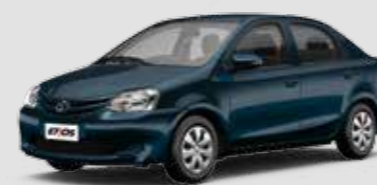
Etios X 1.5

Air bag frontal duplo, freios ABS com EBD, direção eletroassistida progressiva, desembaçador traseiro, ar-condicionado, porta-luvas climatizado, acabamento do painel Total Black, travas e vidros elétricos, espelhos retrovisores externos elétricos na cor do carro, ajuste de altura no banco do motorista, maçanetas internas cromadas e acabamento interno das portas de tecido. Exclusivos para a versão hatchback, aerofólio, limpador e lavador traseiros.