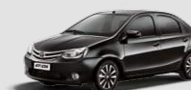
Etios Platinum 1.5

Inclui itens da versão Etios XLS, sistema multimídia com áudio, TV digital, DVD, GPS, câmera de ré e Bluetooth®, design exclusivo da roda de liga leve aro 15", bancos revestidos de couro e material sintético*, grade dianteira cromada, faróis de neblina com acabamento cromado na parte inferior e superior do porta-malas, máscara na lanterna traseira, manopla de câmbio em couro com acabamento cromado na base, e sensor de estacionamento na cor do carro.