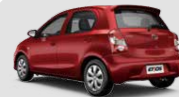
Etios X 1.3

Air bag frontal duplo, freios ABS com EBD, direção eletroassistida progressiva, desembaçador traseiro, ar-condicionado, porta-luvas climatizado, acabamento do painel Total Black, travas e vidros elétricos, espelhos retrovisores externos elétricos na cor do carro, ajuste de altura no banco do motorista, maçanetas internas cromadas e acabamento interno das portas de tecido. Exclusivos para a versão hatchback, aerofólio, limpador e lavador traseiros.