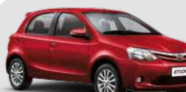
Etios XLS 1.5

Inclui itens da versão Etios XS + rodas de liga leve aro 15", faróis de neblina dianteiros, volante de couro, grade dianteira com acabamento cromado, espelhos retrovisores elétricos com piscas integradas, bancos Comfort Drive**, friso cromado na parte superior do porta-malas e rádio com função MP3, entrada USB, Bluetooth® e conexão smartphone.