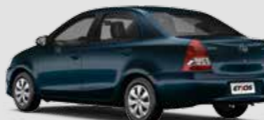
Etios XS 1.5

Inclui itens da versão Etios X + acabamento preto na coluna central (exceto veículo na cor Preto Rock), acabamento dos bancos em tecido (parte anterior dos braços) e material sintético, difusores de ar com acabamento cromado, sistema de alarme, chave com controle de abertura das portas, volante com controle de áudio, rádio com função MP3, Bluetooth® e entrada USB, dois alto-falantes e dois tweeters.