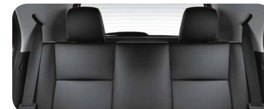
Bancos Comfort Drive 2