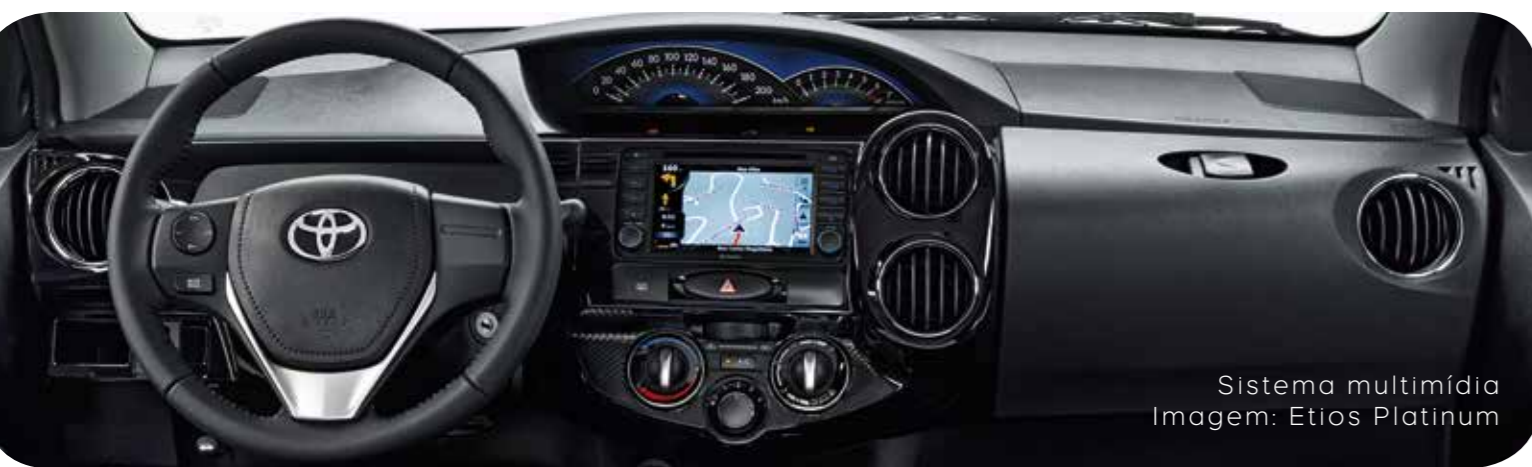
Sistema multimídia Imagem: Etios Platinum