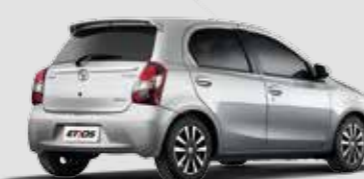
Etios Platinum 1.5

Inclui itens da versão Etios XLS, sistema multimídia com áudio, TV digital, DVD, GPS, câmera de ré e Bluetooth®, design exclusivo da roda de liga leve aro 15", bancos revestidos de couro e material sintético*, grade dianteira cromada, faróis de neblina com acabamento cromado na parte inferior e superior do porta-malas, máscara na lanterna traseira, manopla de câmbio em couro com acabamento cromado na base, e sensor de estacionamento na cor do carro.