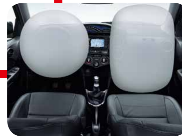
Air bag frontal O teste feito no Toyota Etios pelo Latin NCAP ocorreu no dia 17/10/2012 em Landsberg, na Alemanha. Resultado disponível em www.latinncap.com .

*Banco com partes revestidas de couro (parte anterior dos bancos dianteiros e traseiros) e partes revestidas de material sintético (parte posterior dos bancos dianteiros, laterais dos bancos dianteiros e traseiros, laterais e parte anterior e posterior dos apoios de cabeça dianteiros e traseiros). Etios Platinum disponível nas cores Preto Rock, Prata Soul e Branco Pérola. **Revestidos de material sintético.