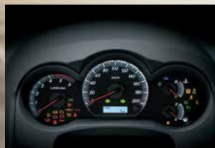
Painel de instrumentos com tecnologia Optitron 3