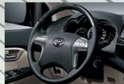
Volante com comandos integrados de telefone, áudio, vídeo e computador de bordo 1