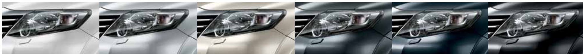
Branco Polar - 040