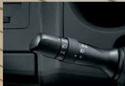
Acendimento automático dos faróis 1