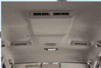
Ar-condicionado traseiro com difusores no teto para a segunda e a terceira fileiras de bancos e controle de intensidade 1