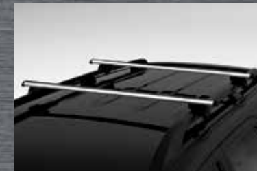
Rack para teto