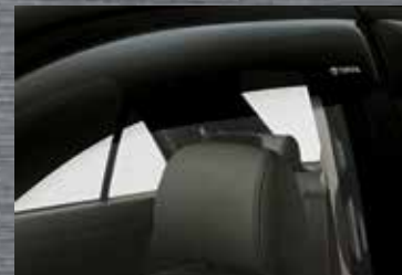
Calhas da porta