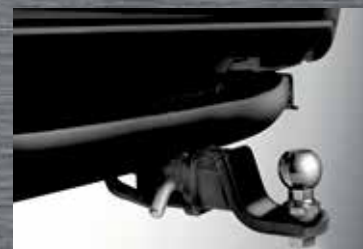
Engate de reboque