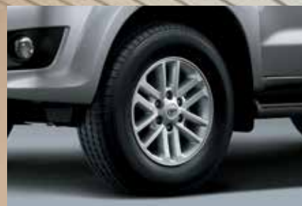
Rodas de liga leve aro 17 2 e pneus 265/65 R17