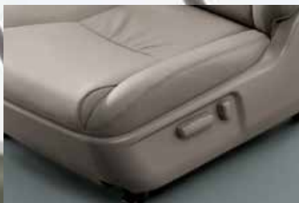
Banco do motorista com ajustes elétricos 1

OS ACESSÓRIOS TOYOTA SÃO DESENVOLVIDOS SEGUINDO OS MAIS RÍGIDOS PADRÕES DE QUALIDADE.