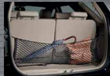
Rede de porta-malas

OS ACESSÓRIOS TOYOTA SÃO DESENVOLVIDOS SEGUINDO OS MAIS RÍGIDOS PADRÕES DE QUALIDADE.