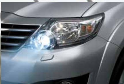
Faróis baixos de xênon com regulagem automática de altura e lavador 1