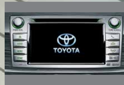
Sistema multimídia com tela de 6,1" sensível ao toque com GPS integrado para navegação, câmera de ré, leitor de DVD 1 *, TV digital 1 ***, Bluetooth®, conexões USB e Aux-in compatíveis com iPod® e iPhone® e rádio com CD player/MP3 1