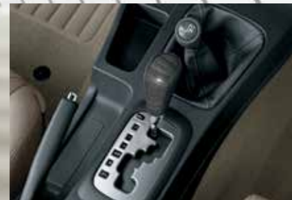
Transmissão automática de cinco velocidades com inteligência artificial 3