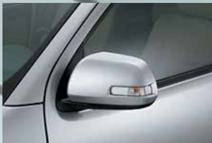
Retrovisores externos eletrorretráteis com indicadores de direção 2