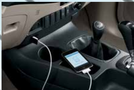
Conexões USB e Aux-in, também compatíveis com iPod® e iPhone® 1