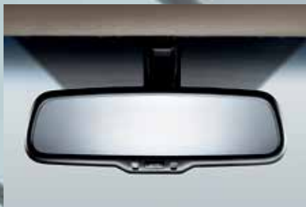
Retrovisor interno eletrocromico 3