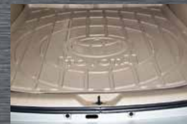
Bandeja de porta-malas (veículos com apenas cinco lugares)

Os acessórios poderão ser adquiridos na rede de concessionárias Toyota, sujeitos à disponibilidade no mercado brasileiro no momento da compra. Alguns acessórios não são compatíveis com certas versões de acabamento da SW4. Consulte o distribuidor autorizado Toyota de sua região para mais informações.