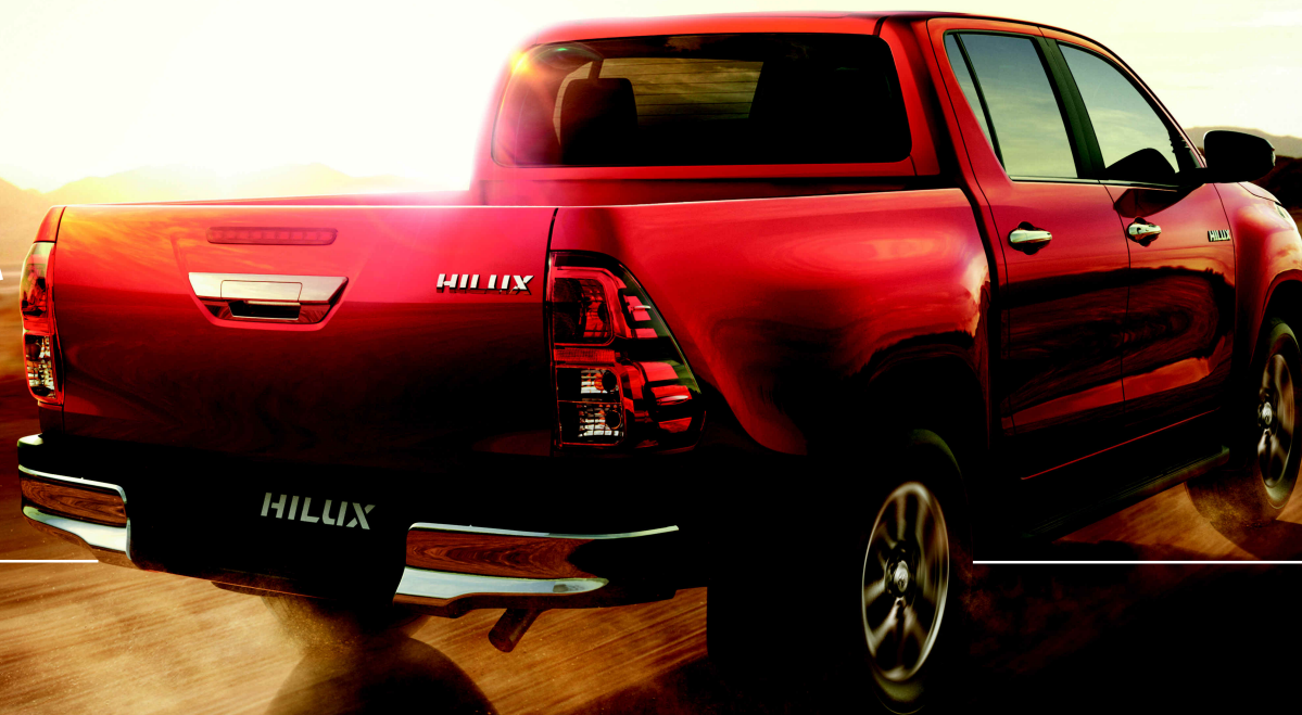
Imagem da Hilux SX.

Resistência e durabilidade são essenciais para superar desafios cada vez maiores, por isso a nova geração da Hilux foi projetada para atingir altos níveis de segurança e controle até mesmo nas condições mais extremas. Sua estrutura robusta e reforçada absorve impactos de maneira eficaz, garantindo segurança ao condutor e passageiros.