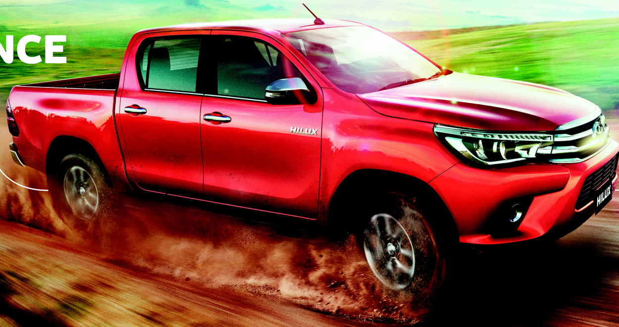
Imagem da Hilux 3.6