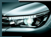
Imagem da Hilux SRX.

Com um desenho moderno e robusto, a nova Hilux está ainda mais imponente. As rodas de liga leve de 18" entregam esportividade e melhoram o desempenho da suspensão. Os faróis com lâmpadas de LED 3 melhoram a visibilidade e deixam sua Hilux ainda mais bonita. Internamente, o painel une um acabamento sofisticado às funcionalidades que tornam o seu dia a dia mais fácil e prático.