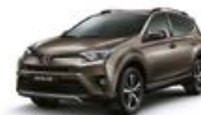
4T3 – Bronze Metálico