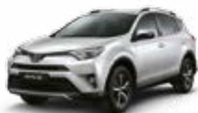
070 – Branco Perolizado