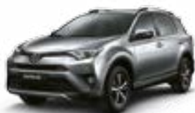
1D6 – Prata Névoa