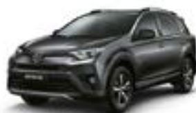
1G3 – Cinza Granito