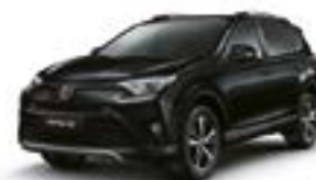
209 – Preto Eclipse