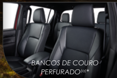
BANCOS DE COURO PERFURADO (a) *