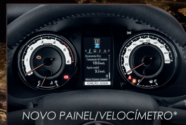
NOVO PAINEL VELOCÍMETRO*