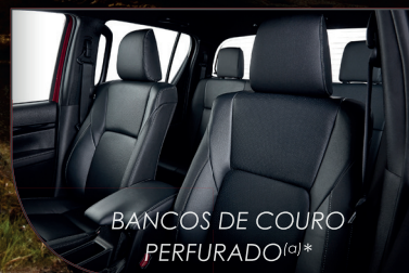
BANCOS DE COURO PERFURADO (a)*