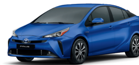
Azul Lazúli cód. 8X7