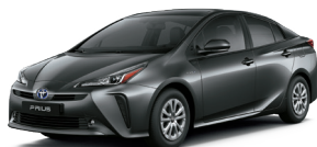
Cinza Granito cód. 1G3