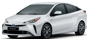
Branco Polar cód. 040