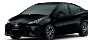
Preto Atitude cód. 218