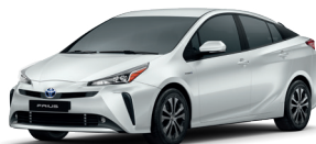
Branco Perolizado cód. 070