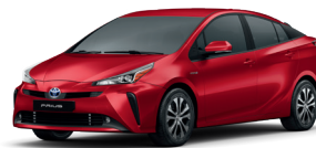
Vermelho Rúbio cód. 3U5