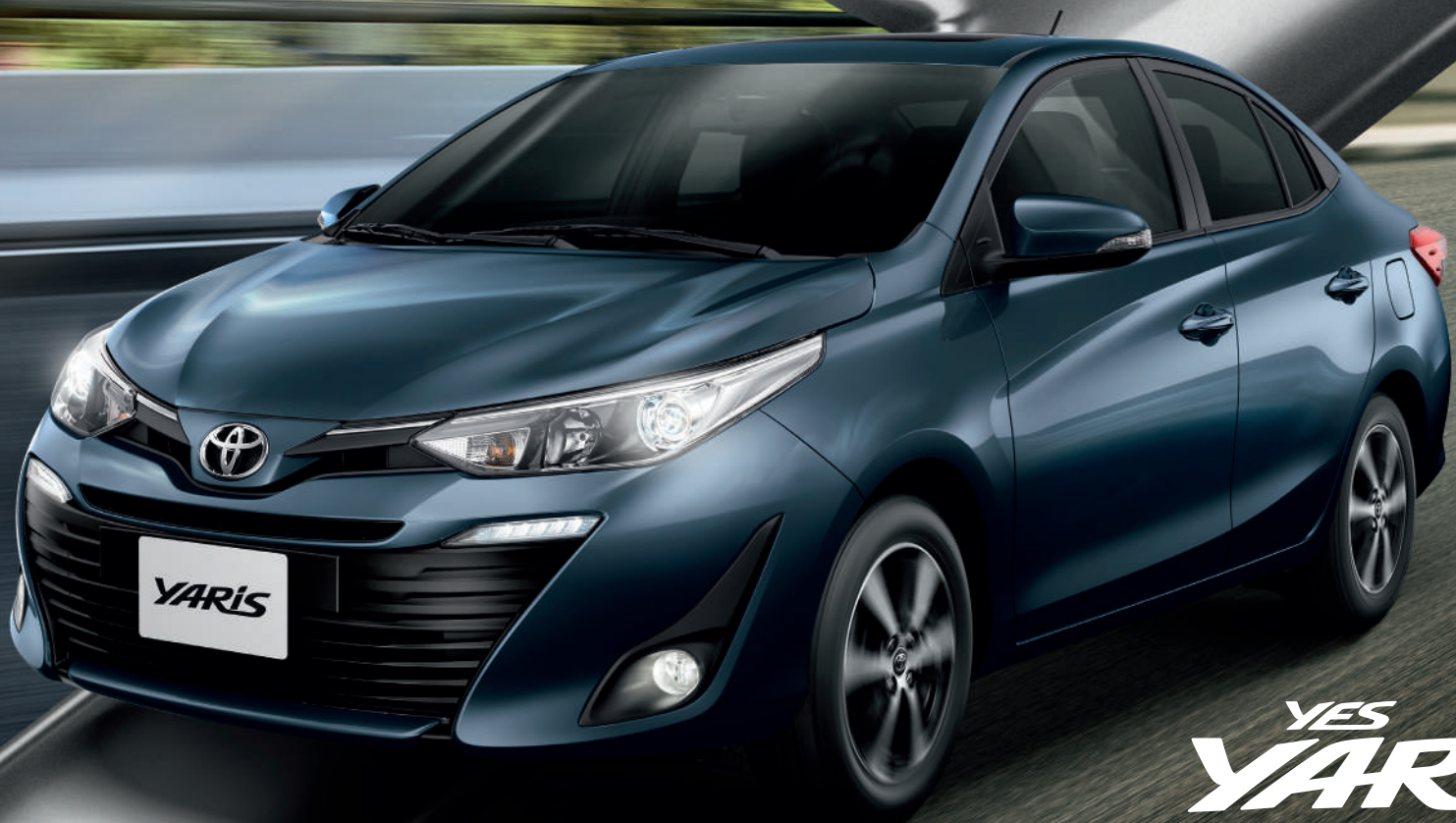
Imagem do Yaris XLS Connect.