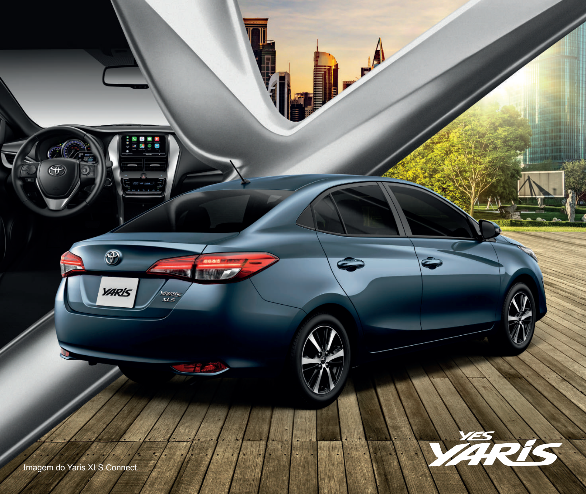
Imagem do Yaris XLS Connect.